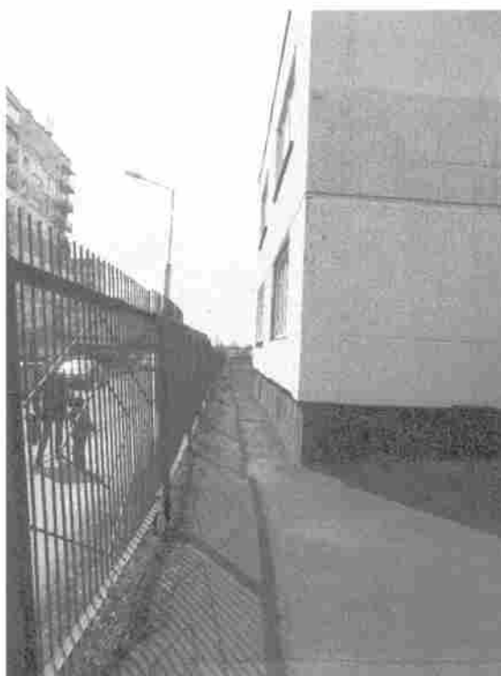
Фото 6. Пути движения на территории