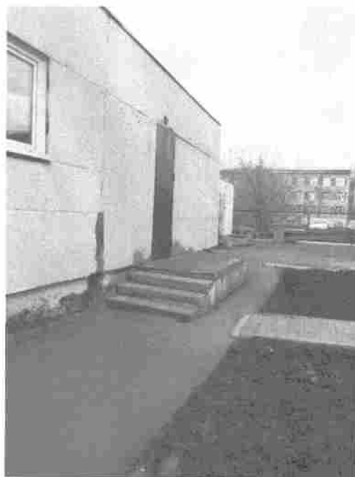
Фото 14. Пути движения на территории