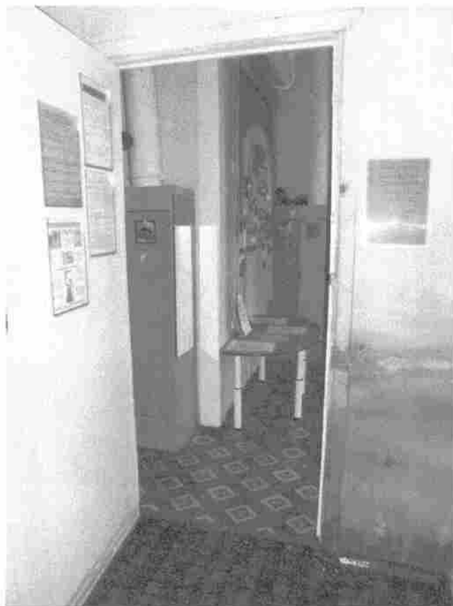
Фото 29. Групповая. Дверь (открыта)