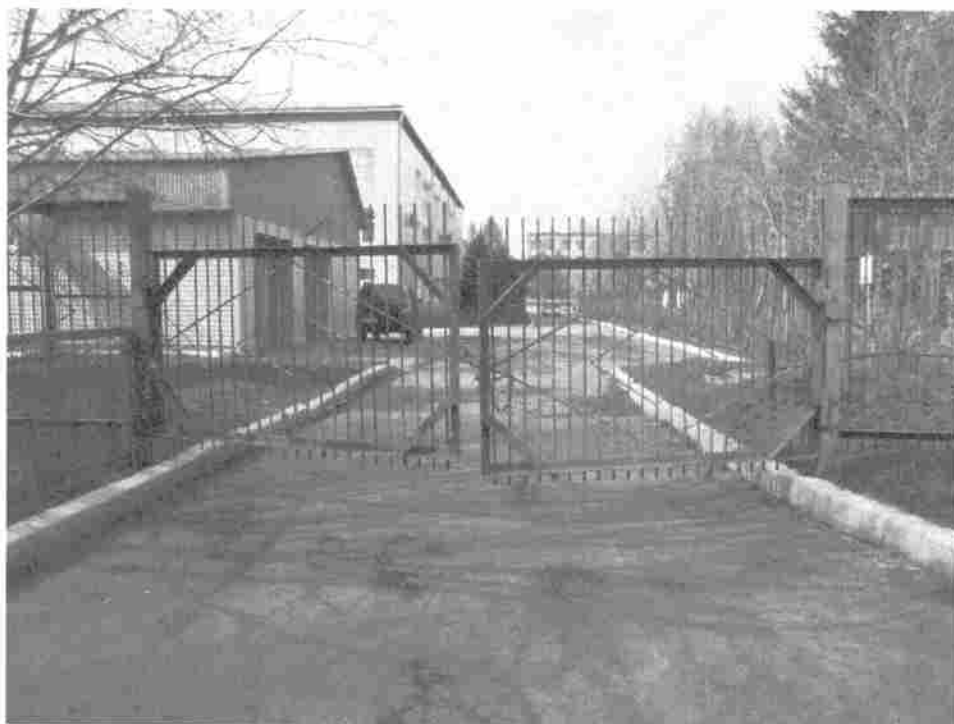
Фото 4. Ворота хозяйственные (открыты)