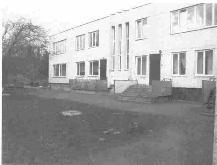
Фото 8. Пути движения на территории