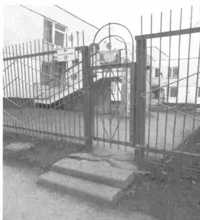
Фото 2. Центральный вход (калитка открыта)