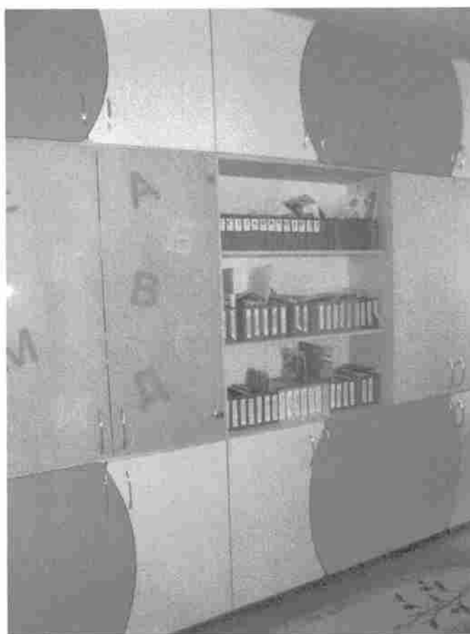
Фото 41. Кабинет логопеда